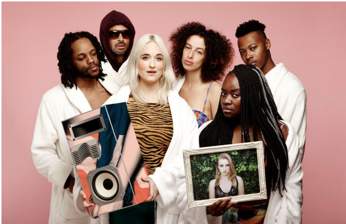
campagnebeeld Pang Pang