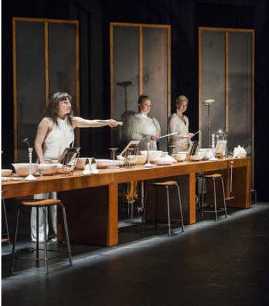
De vrouwen van Ragazze Quartet zitten als volgelingen aan een eettafel.