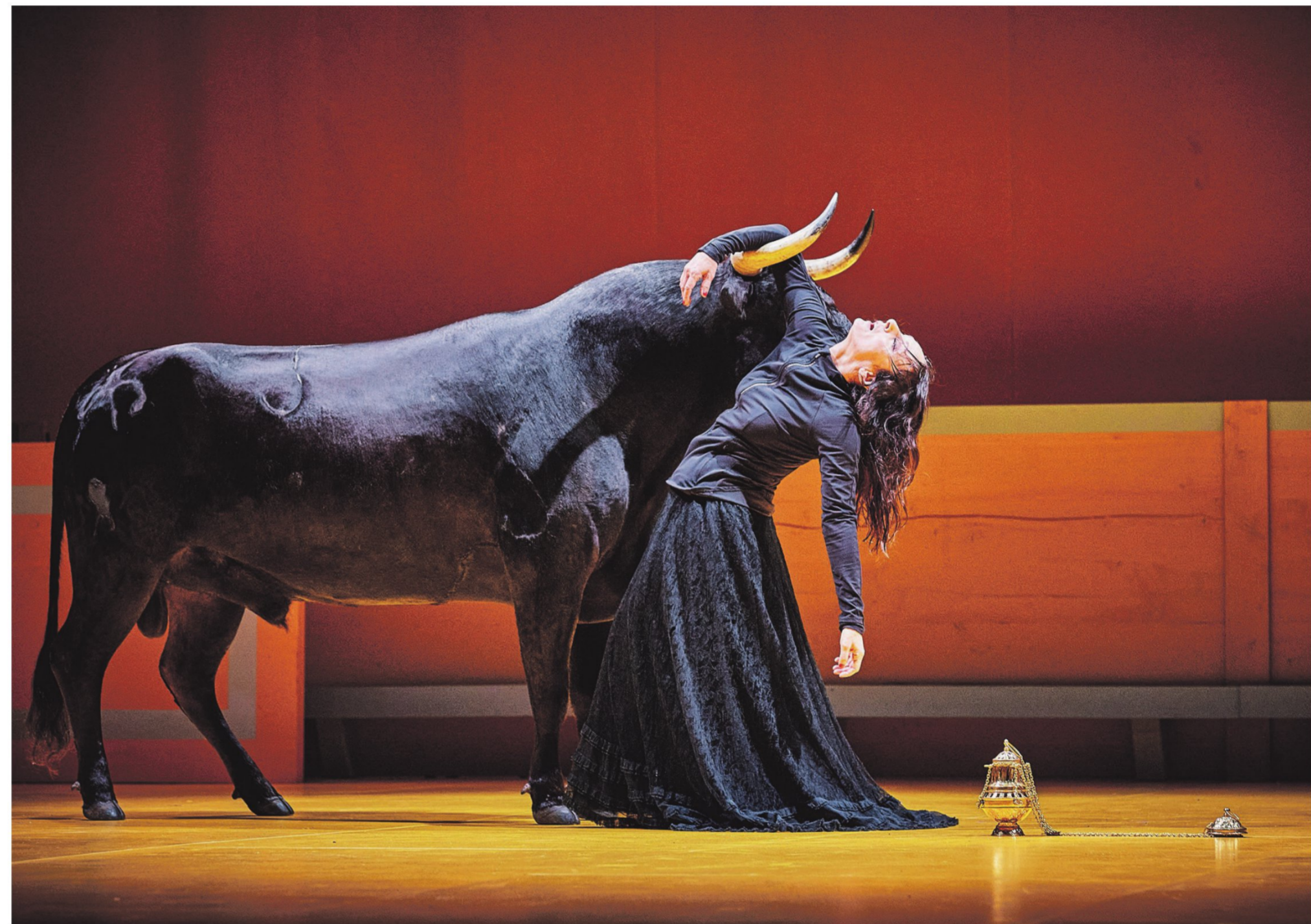
Angélica Liddell in Liebestod .

'Mijn moeder komt uit Extremadura, een afgelegen, landelijke regio